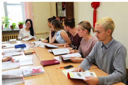
Занятия по изучению китайского языка